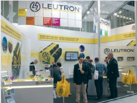
世界最大級の「照明・建築技術見本市」(ドイツ)