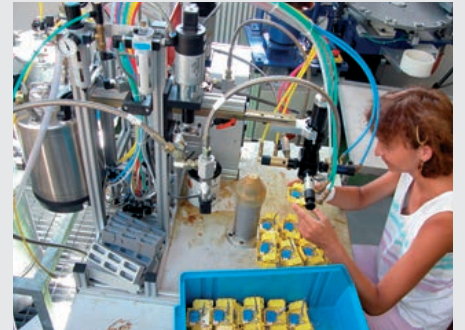
自社工場でのSPD組立て